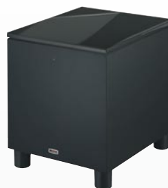
MS SW-12 Aktiv-Subwoofer