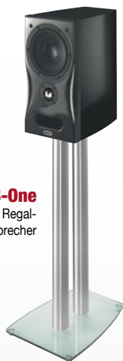
MS B-One Regal- Lautsprecher