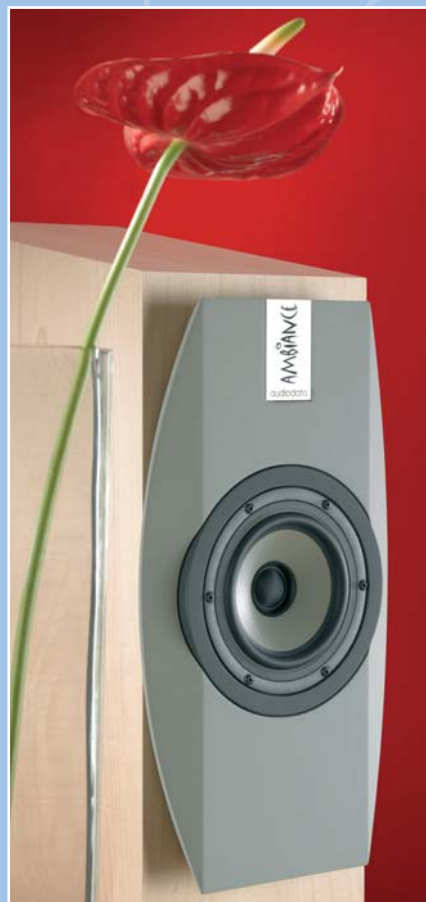
Die Ambiance – ein Blickfang in jedem Wohnraum.

Letztendlich dient unser Engagement nur einem Zweck: Ihnen Musik mit ihrem ganzen Klangspektrum zu vermitteln, ohne dabei auf Wohnkultur zu verzichten.